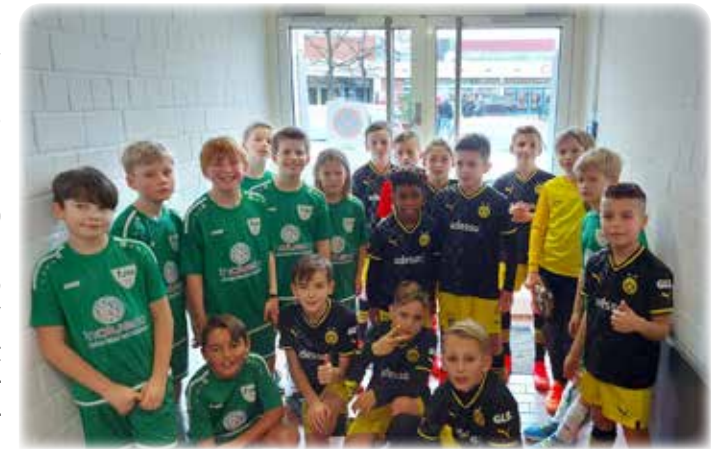
U10 der JSG mit der U10 von Borussia Dortmund.